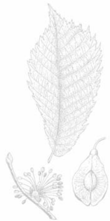
Kresba: Ing. Pavel Šterba Vydání: Město Strakonice

Historické souvislosti: Pravděpodobně vysazen kolem druhé poloviny 19. Století v rámci zřízení romantického parku u zámku v Kladruzech rytířskou rodinou von Taschek. Jedním z romantických prvků parku je zeď představující dračí tělo a je doplněna dřevěnou dračí hlavou pobitou plechem. Tento drak je symbolem Kladrub.